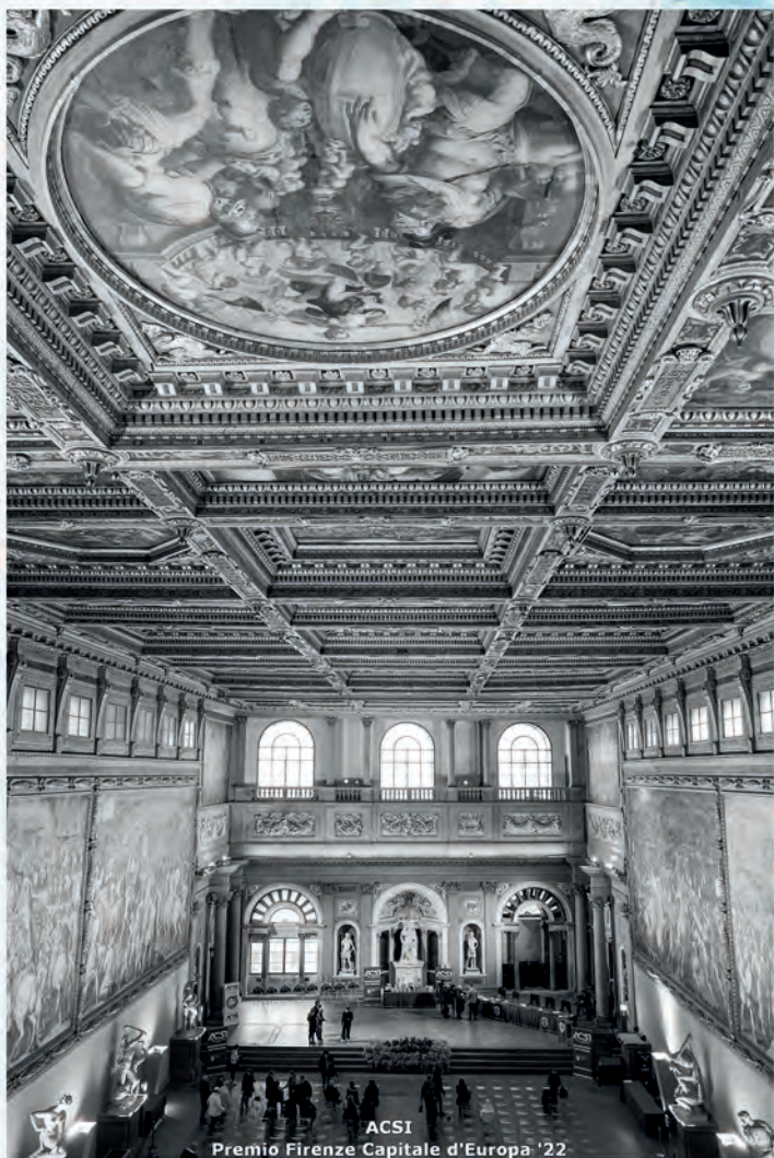
ACSI Premio Firenze Capitale d'Europa '22